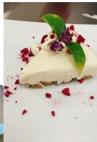
morning till night,

Last month, I helped catering for open night. This month, I became part of cooking for the school restaurant which was held for two nights after school. I was responsible for making rum and raisin cheesecake for dessert. We spent whole two days for training and improving the recipe and another whole two days for serving them. I was exhausted at the end of the restaurant since I kept making those from but our team really enjoyed contributing to it.