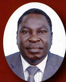
ブルキナファン 駐日特命全権大使 パスカル・バジヨボ閣下

■主催：駐日ブルキナファン大使館 ■共催：調布市、調布市国際交流協会 ■協力：Increase Corporation ■Special Thanks：モリンガの郷、道祖神 ■問い合わせ先：駐日ブルキナファン大使館