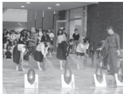
中2の初期消火訓練の様子