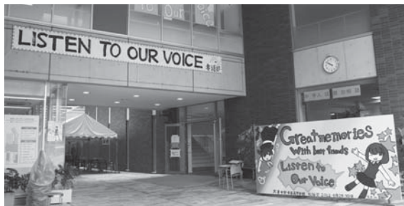
今年のテーマは「Listen to our voice!」

私たち高校2年5組「ル・シネマ ミカデリ」は映画を上映しました。台本から撮影、衣装、編集まで全部自分たちでやり、とても大変でした。夏休みは撮影の日々で、挫折しそうなったときもたくさんありました。しかし先生方や支えてくれる友達のおかげで、無事完成させることができ、そしてその優